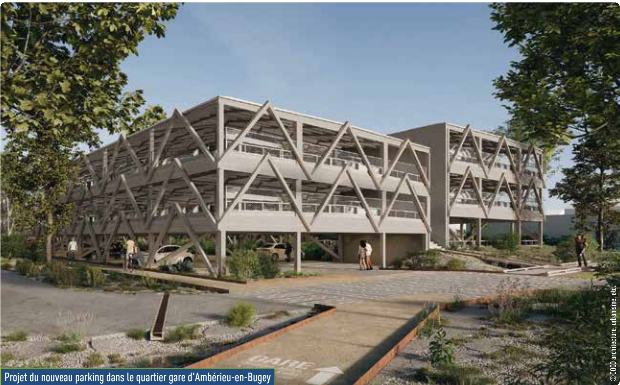
Projet du nouveau parking dans le quartier gare d'Ambérieu-en-Bugey

Ce projet ambitieux contribuera à faire du quartier de la gare un véritable cœur de mobilité durable pour Ambérieu-en-Bugey et l'ensemble du territoire.