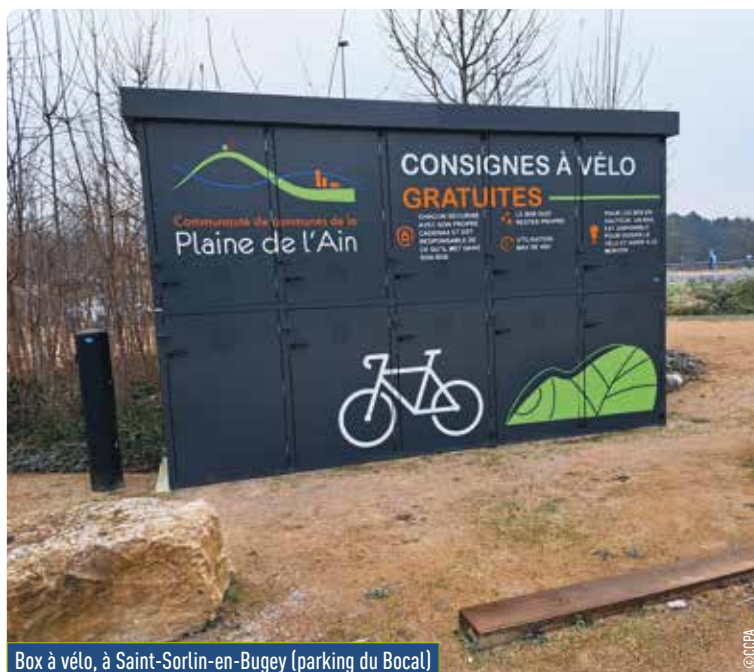
Box à vélo, à Saint-Sorlin-en-Bugey (parking du Bocai)

La CCPA poursuit son engagement en faveur d'une mobilité plus durable et plus simple au quotidien. Aujourd'hui, les solutions de déplacement partagé s'intègrent pleinement dans un réseau pensé pour faciliter les correspondances et offrir des alternatives à la voiture individuelle.