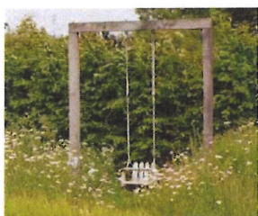
Ponctuer l'espace de mobilier