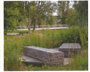
Quelques assises, tables et bancs dispersés dans le parc