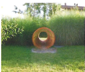
Jouer avec les points de vue et l'horizon